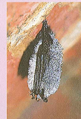
Vespertillon à moustaches