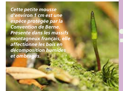
Cette petite mousse d'environ 1 cm est une espèce protégée par la Convention de Berne. Présente dans les massifs montagneux français, elle affectionne les bois en décomposition humides et ombragés.

Plusieurs placettes de suivi ont été déterminées afin d'analyser l'évolution de ces mousses sur les années à venir. Il est important de noter que la présence de la Buxbaumie est directement liée à celle du bois mort en forêt, il est donc recommandé d'en laisser le plus possible au sol et de favoriser la mise en place d'îlots de vieillissement à proximité des stations identifiées afin de pérenniser les populations.