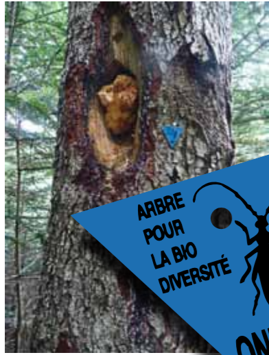
Arbre «bon pour la biodiversité»

A la suite de la 4 ème année d'animation du site Natura 2000, un constat s'impose : la Vallée du Rioumajou et du Moudang est un site dynamique, tant au niveau forestier qu'au niveau pastoral, avec des mesures exemplaires. Voici un bilan des actions menées en 2009 et 2010, et les perspectives à venir :